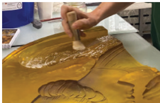
Application de démoulant pour protéger le verre original

- Des moules en silicone ont été confectionnés à partir d'une verrière existante sur la principe du moulage/contre-moulage, permettant ainsi d'obtenir un moule strictement conforme à l'original.