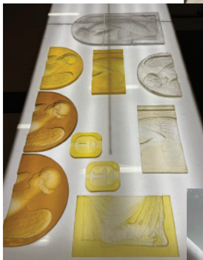
Phases successives de recherche de la bonne colorimétrie, en atelier, puis en exposition à la lumière naturelle du jour.