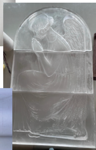
Du blanc pur au jaune dense, une recherche délicate de l'équilibre