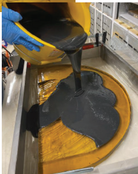
Coulage du silicone à double composant